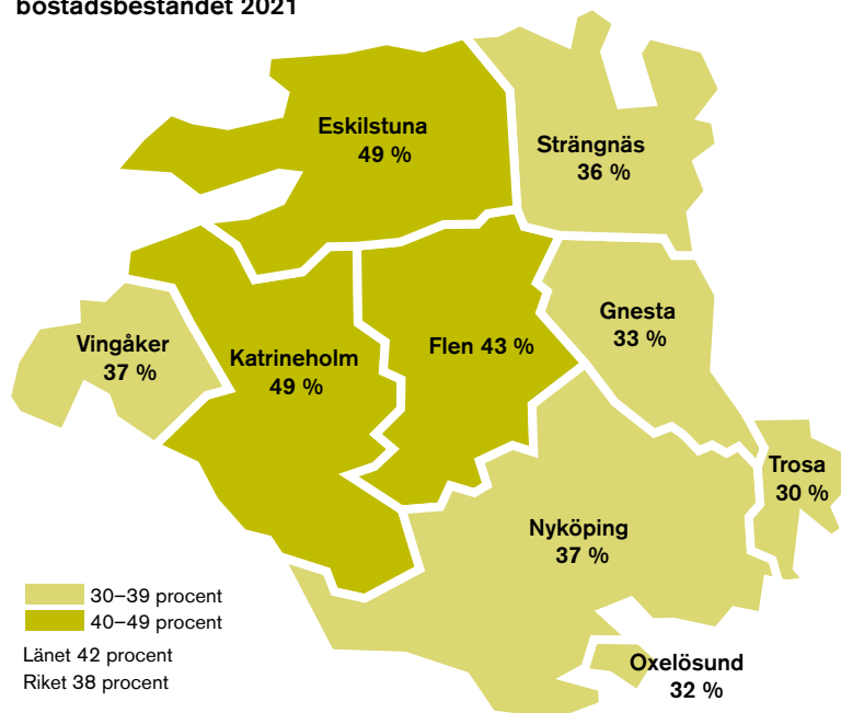
Andel hyresrätter av bostadsbeståndet 2021

Men även här är det stor skillnad mellan kommunerna. Under fliken Kommuner finns diagram över bostadsbeståndets fördelning i varje kommun.